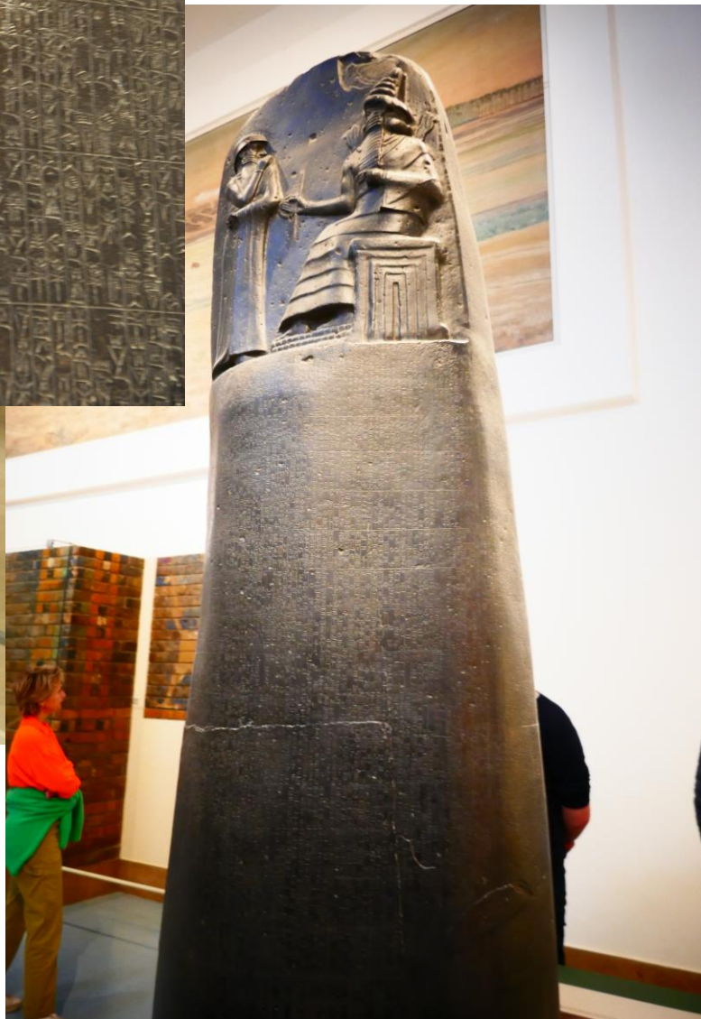
《汉谟拉比法典》 The Code of Hammurabi